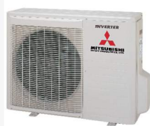
Kompakt kültéri egység