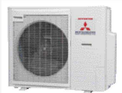
Kompakt kültéri egység